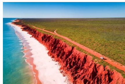
Australien, © Dirk Bleyer

Attraktiv sind auch die Multivisionen auf Großleinwand mit Dirk Bleyer und „Australien – ein Jahr Freiheit“ (3.11.) sowie Dirk Rohrbach und „IM FLUSS - 6000 Kilometer auf Missouri & Mississippi durch Amerika“(17.11.).