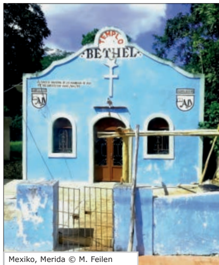
Mexico, Merida