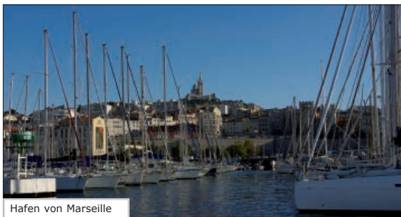
Hafen von Marseille

Voraussetzung: mind. 4 – 5 Jahre Schulfranzösisch oder vergleichbare Kenntnisse.