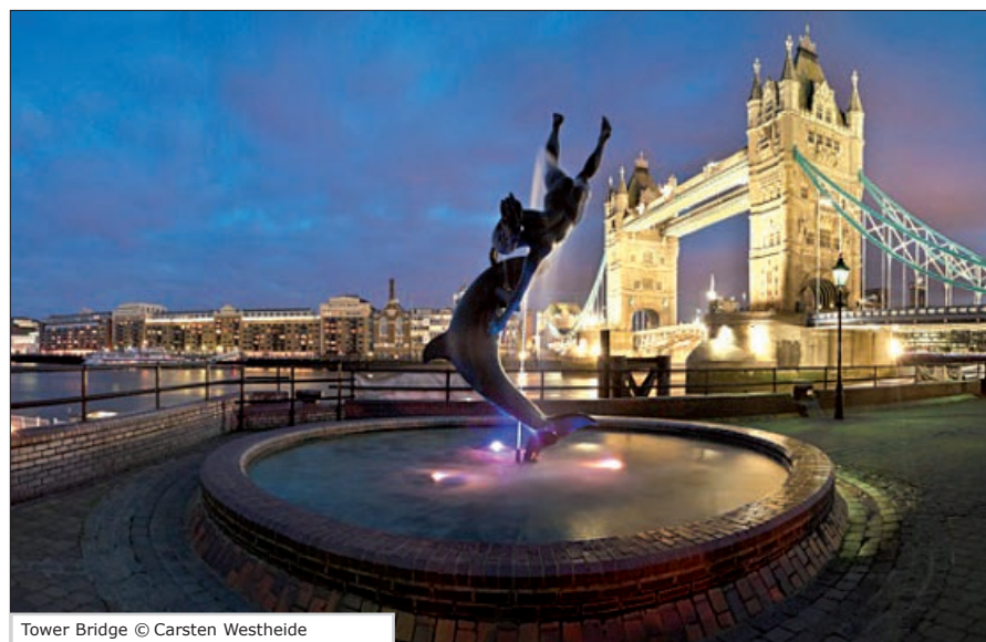
Tower Bridge

Inhaber des S-Club-Kontos der Sparkasse Gladbeck zahlen 8,00 € weniger.