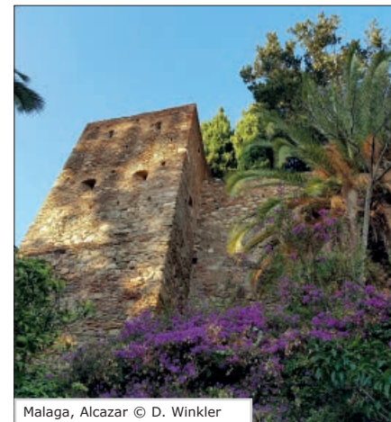
Malaga, Alcazar

Leitung: Mariles Abril-Böhm Termine: ab Di, 4.2.2020, 10.15 - 11.45 Uhr Ort: Haus der VHS, Friedrichstr. 55 Dauer: 10 Termine, 20 U.Std. Entgelt: 102,00 € (keine Ermäßigung)