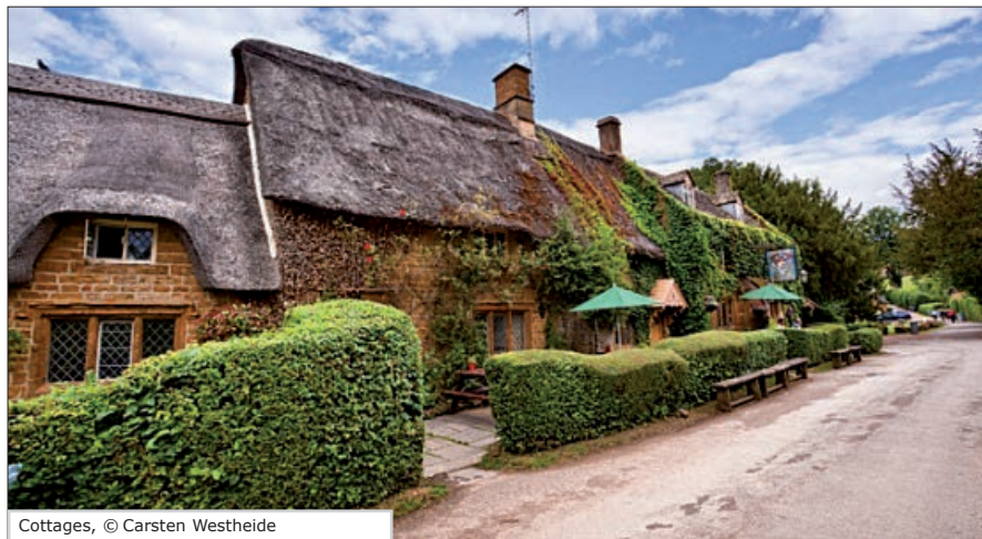
Cottages, © Carsten Westheide

Leitung: Annette Böing Termine: ab Mo, 20.1.2020, 10.15 - 11.45 Uhr Ort: Fritz-Lange-Haus, Friedrichstr. 7 Dauer: 17 Termine, 34 U.Std. Entgelt: 105,40 €