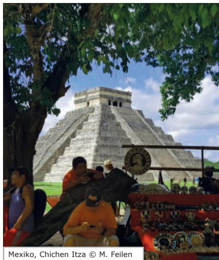
Mexico, Chichen Itza