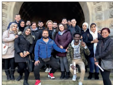
Stadtrundgang – am Eingang zum Rathaus. © Dietrich Pollmann, Foto aus Semester 2/2019

Ort: Haus der VHS, Friedrichstr. 55 + 150,00 € (keine Ermäßigung)