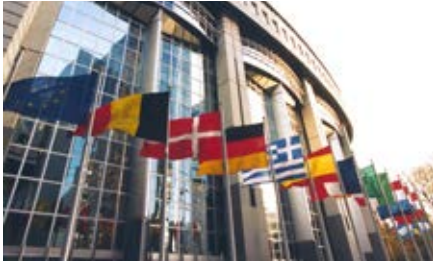
Das Europäische Parlament