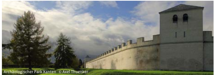
Archäologischer Park Xanten

Letzter Rücktrittstermin: 7 Tage vor der Fahrt.