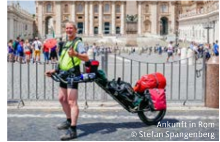
Ankunft in Rom

Lassen Sie sich in einer mitreißenden Beamer-Show auf eine spannende und bewegende Reise mitnehmen. Und es bleibt noch als letztes die Frage: Wie schafft man nach einer solchen Willensleistung wieder den „Turnaround“ in den Alltag?