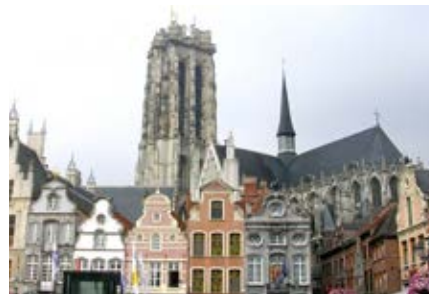
Kathedrale von Mechelen

Flandern! Kaum fällt der Name dieses belgischen Landesteil, öffnen sich bei uns Vorstellungen: Brügge, Gent, Antwerpen mit großen Rathäustürmen, mächtigen Belfrieden und stolzen Kirchtürmen. Von lebhaften Marktplätzen, filigranen Ziegelbauwerken, schmucken Altstadtgassen, Uferwegen mal ganz abgesehen. Nur von Mechelen spricht man nicht, obwohl sie zur Zeit der Habsburger und Burgunder Herrschaft prunkvolle Residenzstadt der Niederlande war. An diese glorreichen Zeiten erinnern viele historische Bauwerke. Der romantische Dilje-Fluss verleiht der Stadt eine romantische Idylle. Wenn die Musik der berühmten Glockenspiel der St. Rombout-