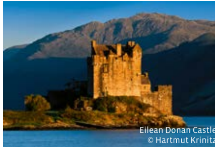
Eilean Donan Castle