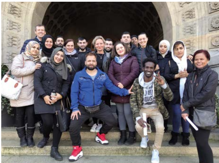
Stadtrundgang – am Eingang zum Rathaus. © Dietrich Pollmann, Foto aus Semester 2/2019