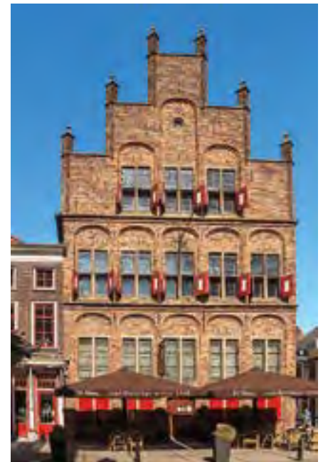
Doesburg, De Waag

Nr. 210, So, 6.7.2025, 13.30 – 18.30 Uhr