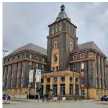
Verwaltungsgebäude Emschergenossenschaft Essen