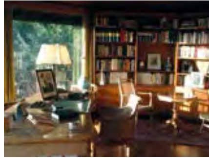
Konrad Adenauer Haus Pavillon Rhöndorf