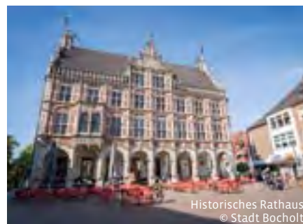
Historisches Rathaus