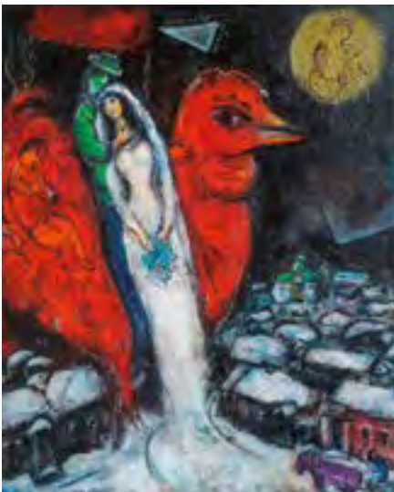
Marc Chagall, Liebespaar mit rotem Hahn © VG-Bild-Kunst Bonn 2024

Nr. 121, Sa, 24.5.2025, 7.00 - 19.30 Uhr