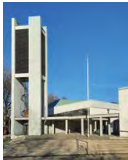
(ehem.) Markuskirche