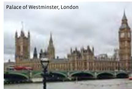
Palace of Westminster, London