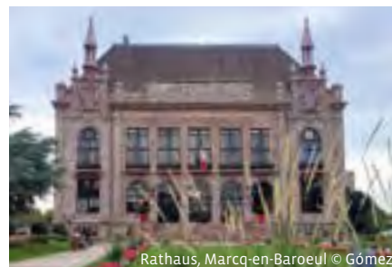
Rathaus, Marcq-en-Baroeul