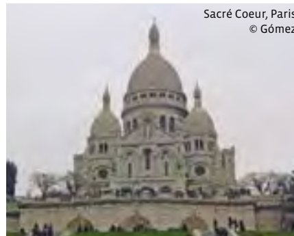
Sacré Coeur, Paris

Letzter Rücktrittstermin: 7 Tage vor Kursbeginn.