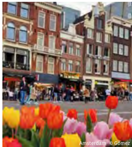
Amsterdam © Gómez

Letzter Rücktrittstermin: 7 Tage vor Kursbeginn.