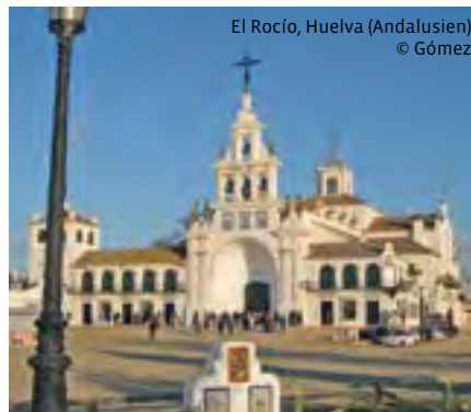
El Rocío, Huelva (Andalusien)