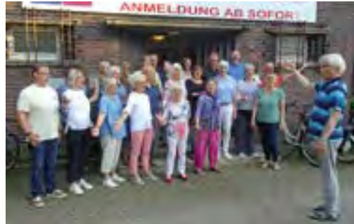
Alegria Cantar 2023