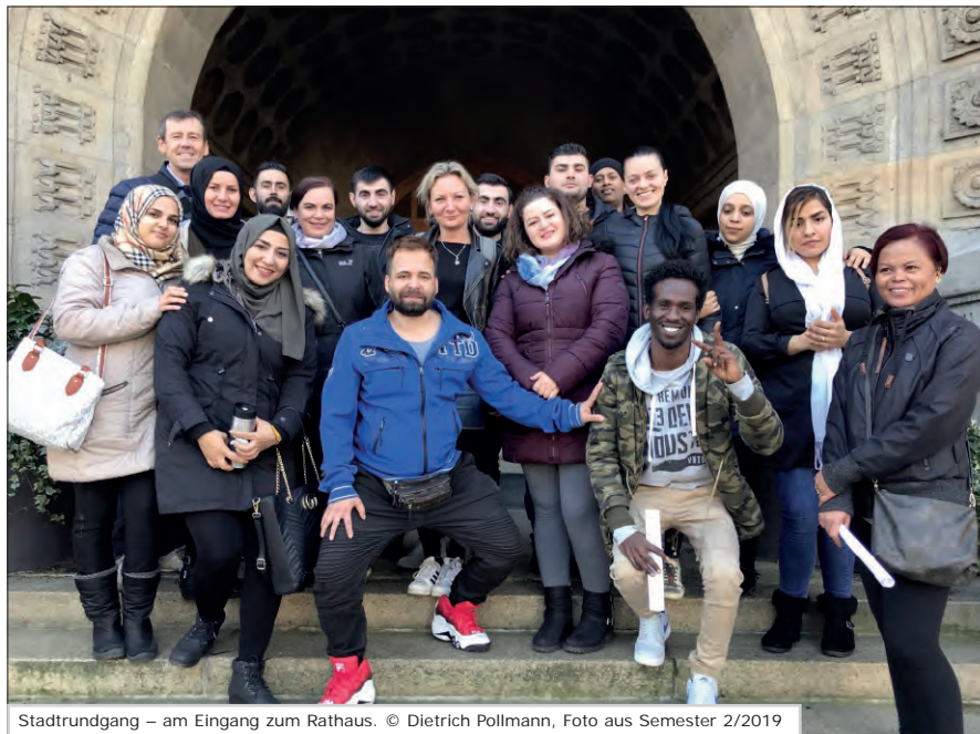
Stadtrundgang – am Eingang zum Rathaus. © Dietrich Pollmann, Foto aus Semester 2/2019

Ort: Haus der VHS, Friedrichstr. 55 + 150,00 € (keine Ermäßigung)