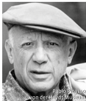
Pablo Picasso © von der Heydt-Museum

Eintrittskarten sind im Haus der VHS erhältlich oder online über die Homepage der VHS buchbar.