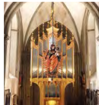
Orgel St. Laurentiuskirche Erwitte