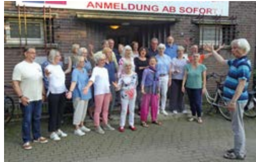
Alegria Cantar 2023