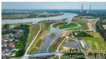
Neue Emschermündung

Leitung: Dr. Dieter Briese Termin: Di, 22.9.2026, 11.45 - 13.30 Uhr Treffpunkt: Gasometer Oberhausen, Arenastraße 11 Entgelt: 22,00 € (Eintritt, Führung)