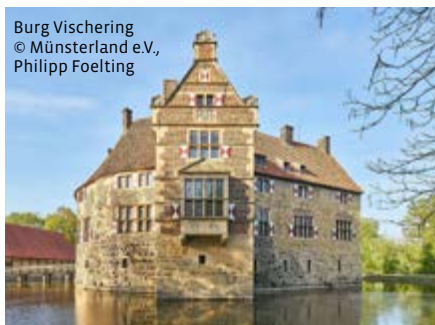
Burg Vischering