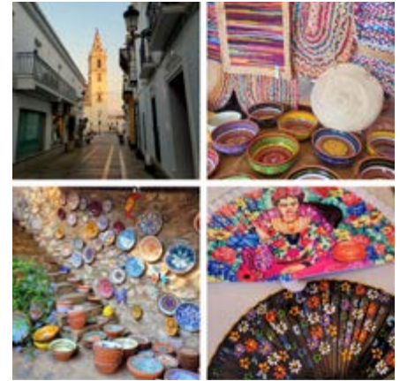
Sierra de Aracena