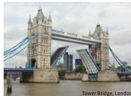
Tower Bridge, London

The talk will finish with time for questions and an open discussion.