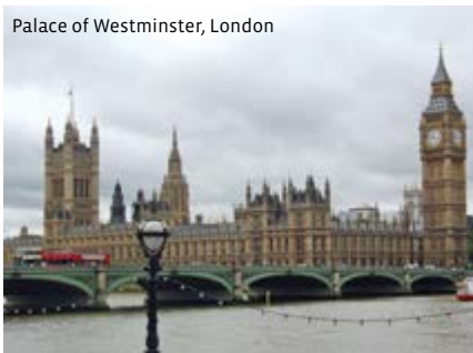
Palace of Westminster, London

Leitung: Veronique Dembeck Termine: ab Mo, 21.9.2026, 18.00 - 19.30 Uhr Ort: (ehem.) Markuskirche, UG, Seminarraum 3, Bülsler Str. 38 Dauer: 10 Termine, 20 U.Std. Entgelt: 100,00 € (keine Ermäßigung)